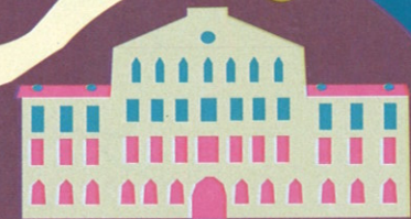
Dr. Nagy László Egységes Gyógypedagógiai Módszertani Intézmény

Tourinform Kőszeg 9730 Kőszeg, Fő tér 2. +36 94 563-120 koszeg@tourinform.hu