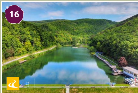
Rechnitz (Rohonc) fürdő és madártorony Rechnitz - Bathing lake and birdwatching tower