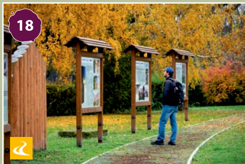
Csepregi túrák Wandering routes of Csepreg