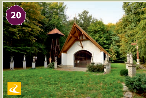
Horvátzsidány, Péruska-kápolna Chapel of Mária Péruska