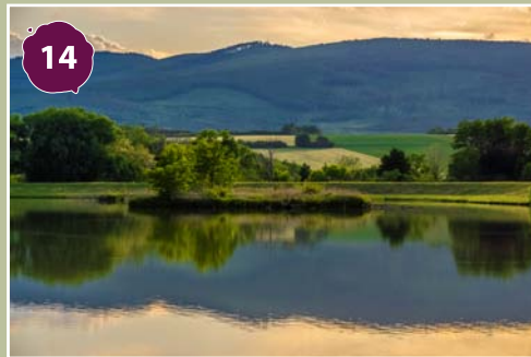
Kőszegi Abért-tó Abért-lake of Kőszeg