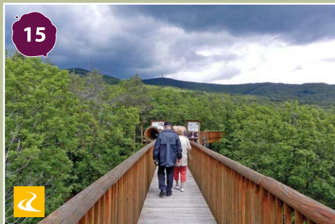
Althodis (Óhodász) lombkorona tanösvény Althodis - Canopy educational trail