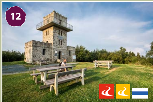
Írott-kő-kilátó Írott-kő lookout tower