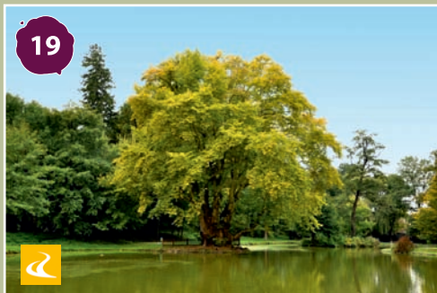
Peresznye, tó óriás platánnal Giant Sycamore tree in Peresznye