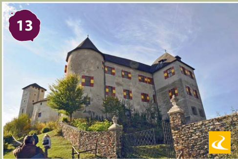
Lockenhaus (Léka) lovagvár Castle of Lockenhaus