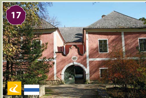
Bozsok, Sibrik-kastély Bozsok, Sibrik Castle