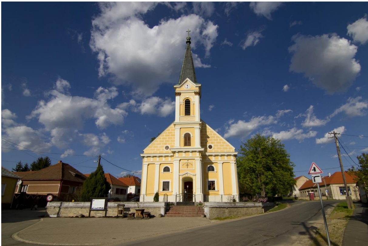
A nemescsói Evangélikus Templom

A templomot 1981-ben hazai és külföldi támogatásból renoválták. Az oltár – mely ma a templom legfőbb díszé - 1713-ban készült, téglalapra, fából. Ez a mai Magyarország egyik legrégebbi evangélikus oltára. Egyenes főpárkánya két stilizált korinthuszi oszlopon nyugszik, kívül két festett angyal keretezi. Az orgonát 1789-ben vásárolták, öt évvel a templom újjáépítése után. A feljegyzésekben ez áll: „1789. Boldogasszony havának 14. napján állíttatott be N.csói ev. templomunkba Kőszegi Kligel József orgona-csináló mestertől 110 rk. forintokon megvásároltatott orgona.”