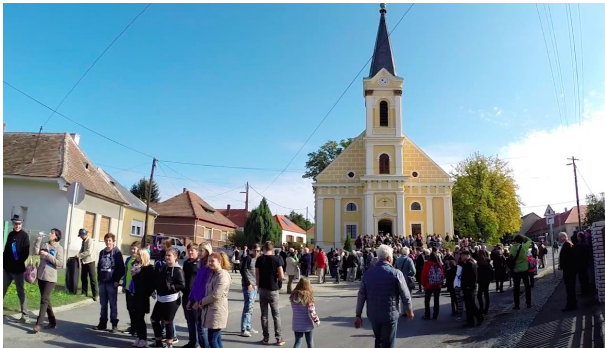
Artikularis nap Nemescsóban 2015