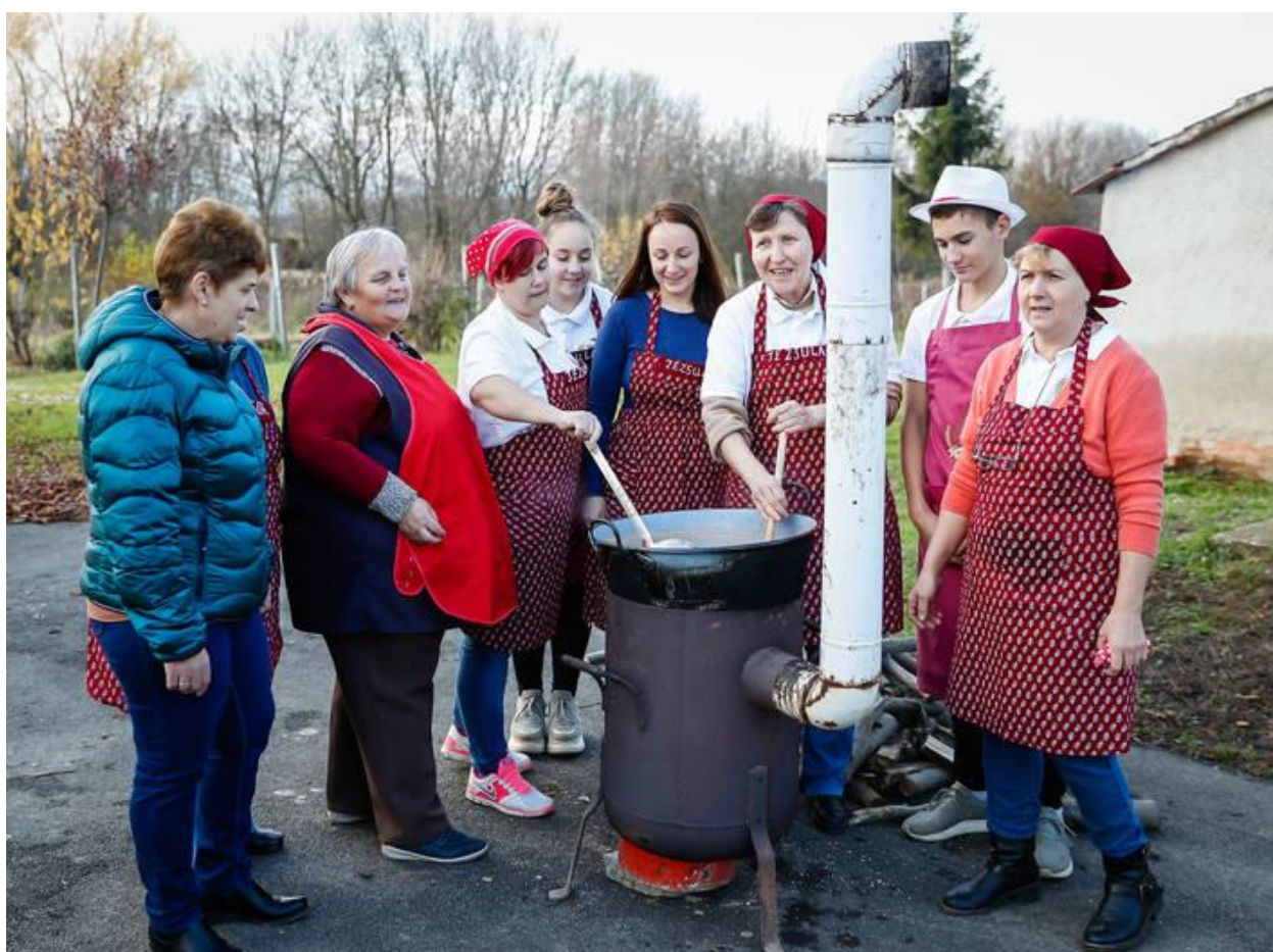
Csipkelekvár rotyog a Tézsula üstjében

Ők maguk is egész életükben tanulták a régi dolgokat. Hol ettől az idős falubeli asszonyoktól lestek el valamit, hol attól. Pár éve Schrott Pálné kukoricacekker fonására taníttatta meg a hagyományőrző hölgyeket.