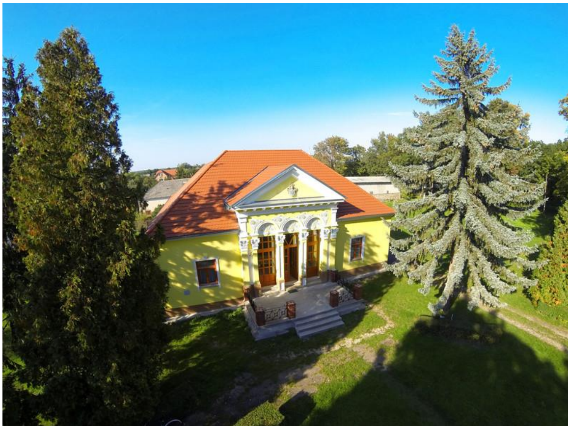
A Weöres kúria

A klasszicista stílusú földszintes épület a község központjában áll. Keletkezéséről nem lehet sokat tudni, a 18. század végén még nem jelöli az I. katonai felmérés a térképen, a 19. század elején azonban már a kúria és a park is fel van tüntetve. Itt született Weöres Sándor költő nagyapja. Az 1890-es évek végén, a kőszegi hadgyakorlatok idején a kor számos fejedelmének, királyának, császárának adott szállást. Egy időben az épület kultúrházként működött, és a falu könyvtárának is helyet adott. Később a termelőszövetkezet tulajdonába került, jelenleg magánkézből van, a mezőgazdasági tevékenységet folytató Jurisics Mezőgazdasági Termelő Szövetkezet székhelye. 2008-ra készület el a Zrt. a felújítási munkálatokkal, melyet pályázati források hiányában, teljes egészében saját erőből valósítottak meg.