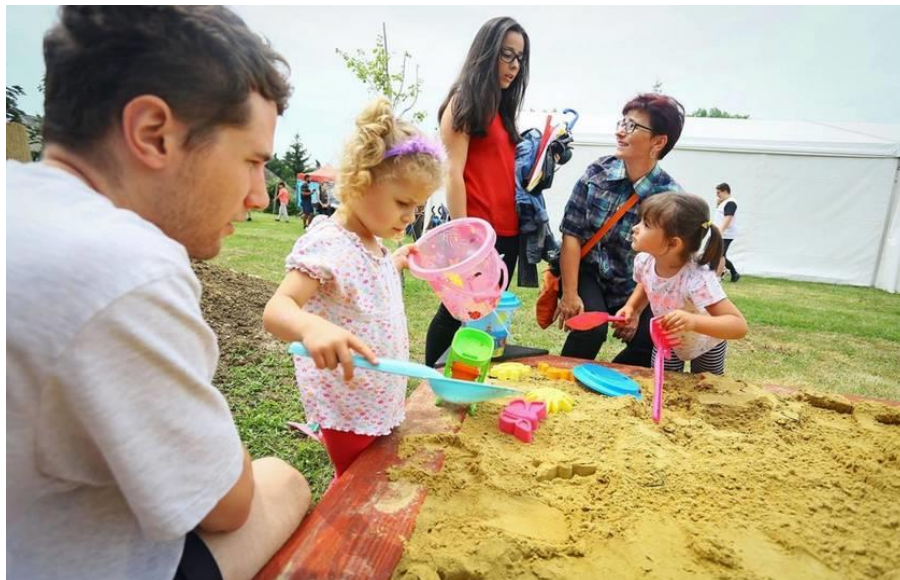
A csói gyerekek 2019-ben vehették birtokba az új játszóteret, és sportpályát

A sportpályát nemcsak a rendezvények idején használhatja szabadon a falu apraja-nagyja, hanem akár naponta kijöhetnek a gyerekek játszani, futkározni, focizni, mely tevékenységek kiváló közösségépítő erővel bírnak.