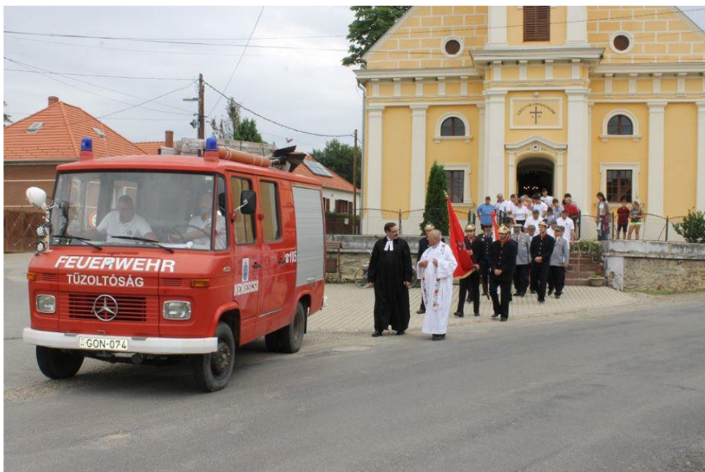
Jubileumi ünnepség: 125 éves a Nemescsói ÖTE (2018)

polgármester – aki önkéntes tűzoltóként is tevékenykedett – egyenruhája is kiállításra került, melyet a család a helytörténeti gyűjtemény egyik kezdeményezőjének adományozott.