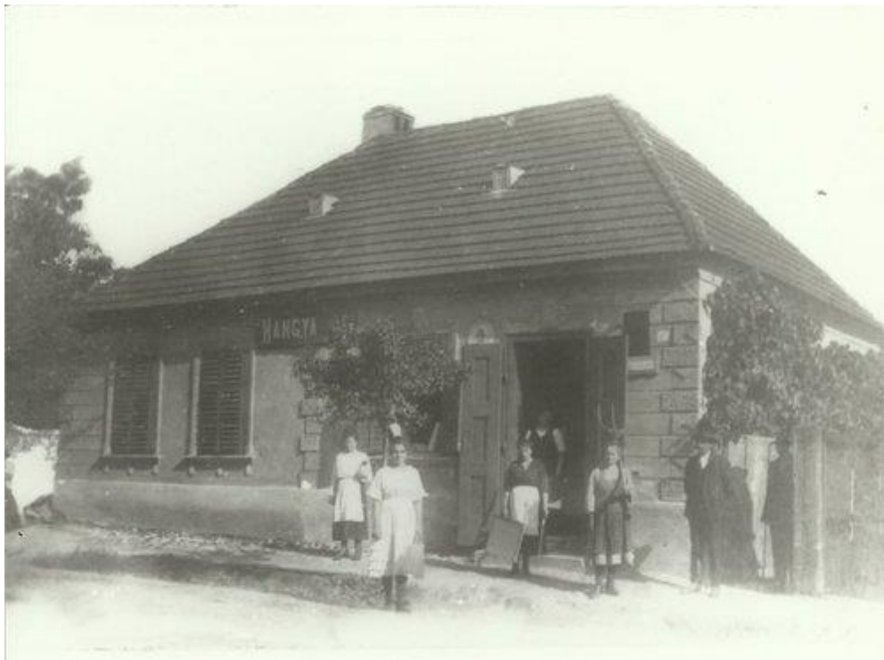
A nemescsői Hangya Szövetkezet

Ma már kevesen tudják, de Magyarország 1920-as években történt felemelkedésében Klebersberg Kunó oktatási programja mellett a Bethlen kormány által a HANGYA szövetkezeti üzletrészához nyújtott állami támogatás volt a meghatározó. Minden idők legsikeresebb magyar összefogása volt fél évszázadon keresztül a HANGYA, mely a legszélesebb társadalmi rétegeket fogta össze, gyakorlatilag Magyarország valamennyi települését az egész Kárpát-medencei régióban.