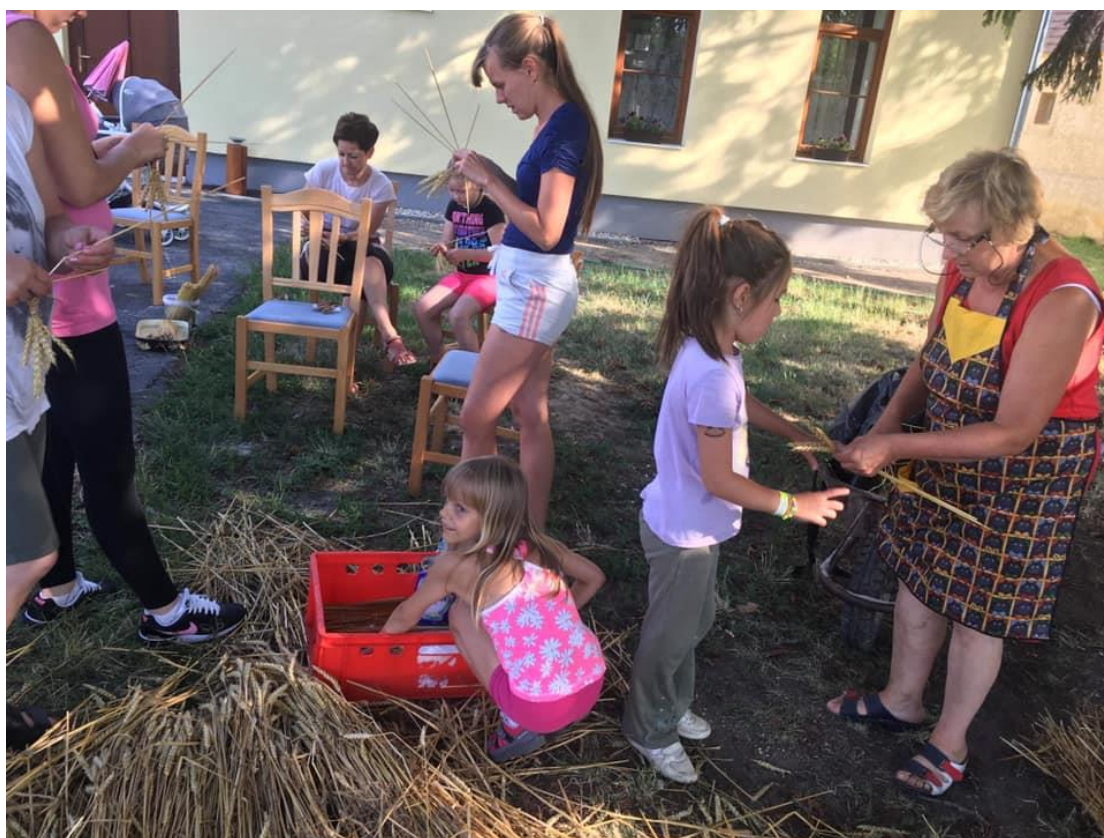
Aratókoszorú készül szalmából (2019)

A falu rendezvényein a gyerekekkel felelevenítik a régi népszokásokat: a lucázást, a korbácsolást, a tojásba dobálást, ugyanígy a régi játékokat is: a kerekezést, vagy a bilickézést. A kerekezés szinte mindenhol elterjedt ügyességi játék volt. A kerékpár kerekét (gumija nélkül) kell egy bot segítségével magunk előtt terelgetni, lehetőleg minél gyorsabban szaladva. A bilickézés az ügyességi játékok mesterképzője. Két fadarab kell hozzá. Az egyik az ütő-bot, a másik pedig maga a bilicke. A játékos ráüt az ütővel a bilickére, mely felpördült a levegőbe. A bilickét minél tovább a levegőben kellett tartani célzott ütésekkel segítve.