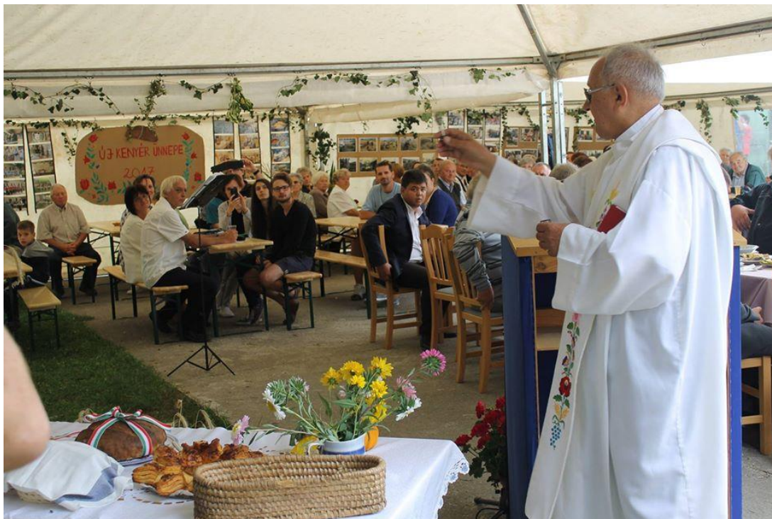
Az Új Kenyér megáldása

elmúlt öt esztendő alatt közel 300 féle hagyományos ételt volt alkalma a vendégeknek megkóstolni. A Kenyérünnep keretén belül – mint ahogy más nagyobb falusi rendezvényeken is – van csuhébaba készítés, aratókoszorú-fonás szalmából, hagyományos fűrészpóros simi-labda készítés a gyerekek örömeire.