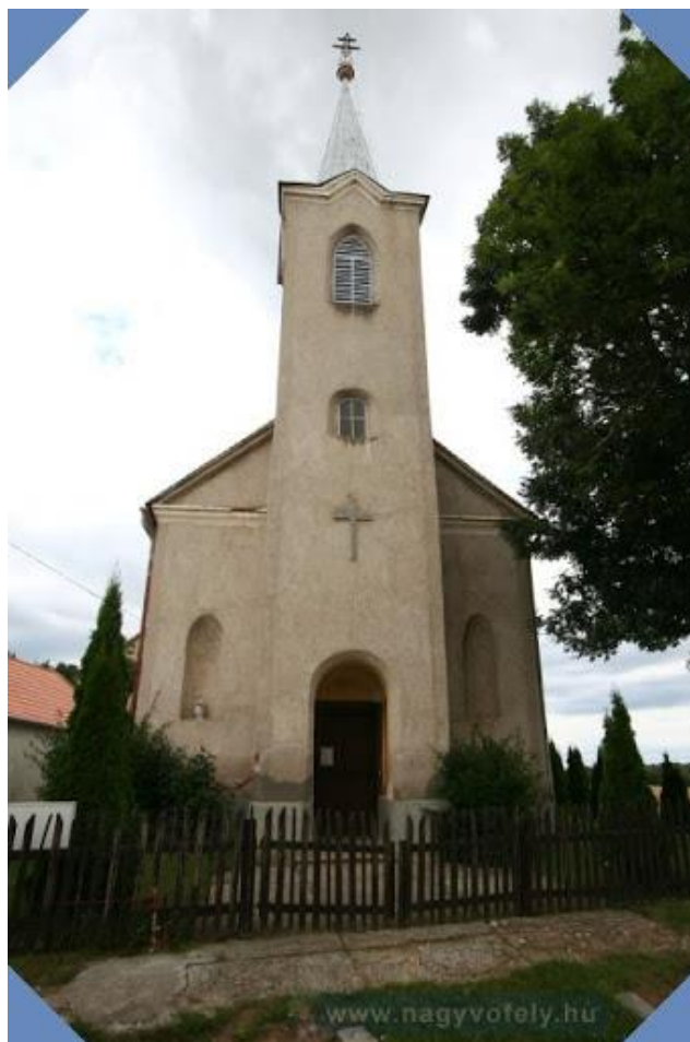
A nemescsói Szent Péter- Pál Templom

A feljegyzésekből kiderül, hogy kezdetben a katolikus hívek kevesen voltak, így Kőszeghez tartoztak, majd 1876-ban építették fel saját templomukat. Az oltár 1762-ből származik, az idősebb hívek elmondása szerint Vát és Szeleste között lévő Szentkút kápolnából. A templom Péter-, és Pál apostolok tiszteletére épült. 1974-ben a templom belső-, és külső vakolatát teljes egészében adományokból felújították. Sort kerítettek az oltár restaurálása, aranyozása is. 1978-ban a harangot újra öntötték, mivel a második világháborúban megsérült.