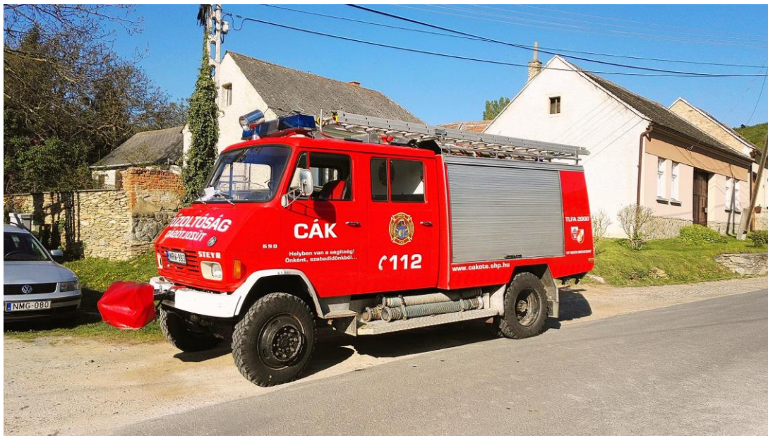
Az ÖTE gépjármű-fecskendője, Fotó: Gál Bea

beindították utánpótlás-nevelő programjukat, amelynek része volt a velemi tűzoltókkal 4 éven át közösen megtartott egyhetes tűzoltótábor is. 2015-ben az egyesület 120 éves fennállására, óriási összefogás eredményeként sikerült megvásárolniuk jelenlegi gépjárműfecskendőjüket az ausztriai Riedlingsdorfból.