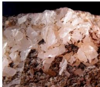
Ásványok a Cáki kőfejtőből