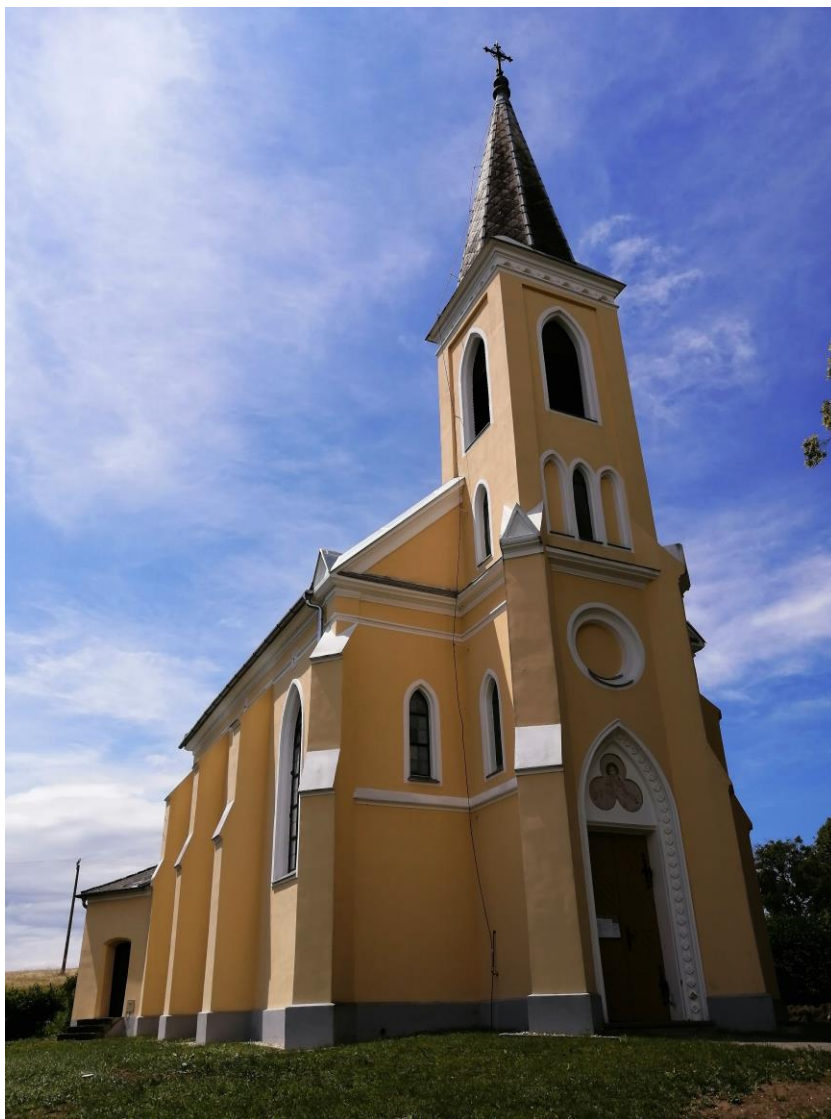
A Szent Péter és Pál apostolok római katolikus templom