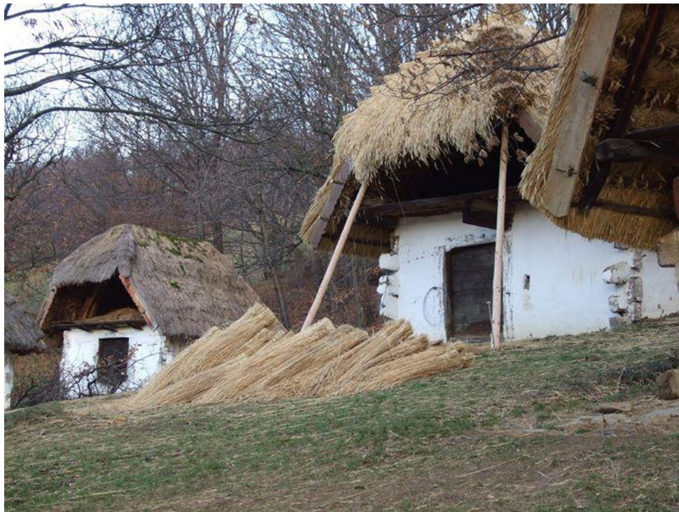
Újrassuppoltási munkálatok 2012-ben, Fotó: Gál Bea

1974-től a Pincésort a Vas Megyei Múzeumok igazgatósága Szabadtéri Néprajzi Gyűjteményként működteti. A pincék bemutatásával hosszú ideig Szigeti Jánosné Mariska néni bízta meg, aki 2010-ig nagy szeretettel fogadta a látogatókat. 2010-ben egy helyi tanárnőt alkalmazott a Savaria Múzeum részmunkaidős múzeumőrként, akit 2013-ban a fenntartói feladatokat átvevő helyi önkormányzat tovább-foglalkoztatott és ezt a munkakört 2016-ig töltötte be. A képviselőtestület támogatásával egyre több látogatót vonzottak a pincésori programok. A gyermekcsoportoknak íjászzal, lovas-kocsizással, kézműves foglalkozásokkal, valamint népi fajtáékokkal színesített programokat szerveztek, a felnőtt és nyugdíjas csoportoknak pedig borkóstolóval és kemencében sült langallóval tették emlékezetessé a pincésor látogatását. 2012-ben a Szombathelyi Múzeumbarát Kör tagjai újrassuppoltak öt pincét, de ez a feladat mára újra esedékessé vált.