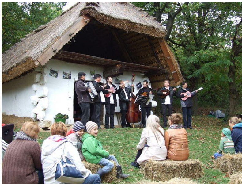
Őszköszöntő szénaszínház, Fotó: Gál Bea

Az Őszköszöntő ünnep pár évvel fiatalabb, 2013-ban rendezték meg először, s ma ez a második legjelentősebb rendezvény a falu életében. Ez a kulturális évad lezárásának ünnepe, mely otthont ad a natúrparki kézművesek vásárának. Az utóbbi két évben Gesztenyeünnep néven hirdették meg, és a Velemi Gesztenyefesztivállal azonos időpontban rendezték. Ezt az időpontegyeztést kezdetben a véletlen hozta, mára azonban egyértelművé vált, hogy a velemi ünnep hatalmas vonzó ereje egyes korábbi látogatókban már a zsúfoltság érzetét kelti. Számukra tökéletes választást kínál a szelídebb hangulatú, családias cáki rendezvény, ahol - mint az a rendezvény elnevezéséből is egyértelmű – fontos szerephez jut a gesztenye. Ezt a finom csemegét sokféle formában megkóstolhatják a látogatók, de haza is vihetnek belőle otthoni sütögetésre.