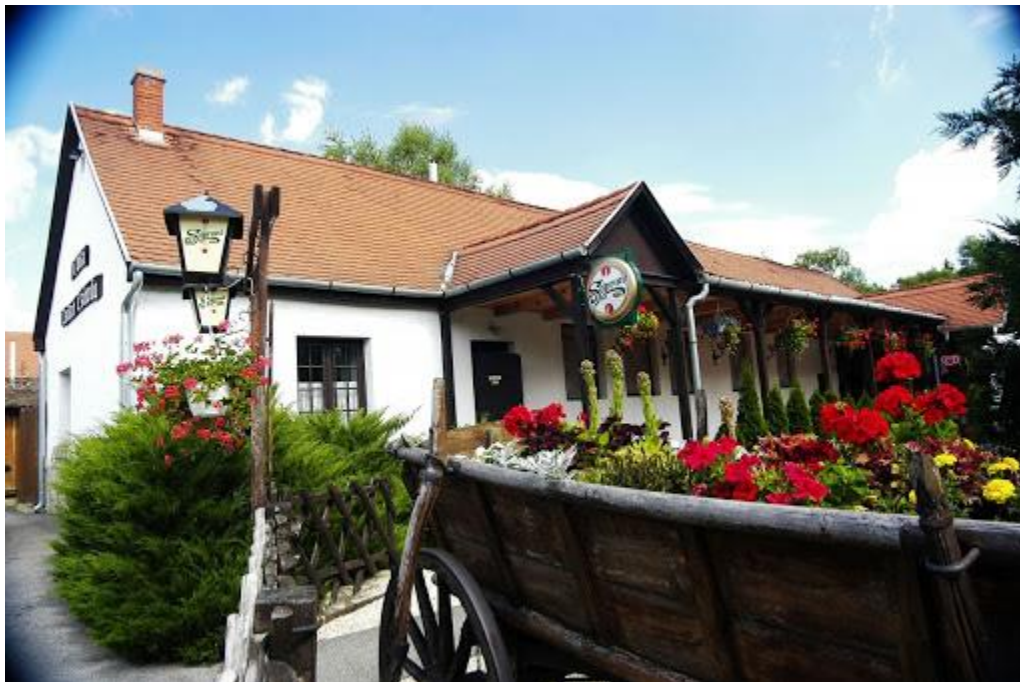
A Cádi Csikó Csárda

A Kőszeg-Rohonccal összekötő közút mellett található hangulatos, étterem tipikus magyaros konyhával, ízletes helyi étel-specialitásokkal egész évben nyitva tart. A fenntartók megőrizték a Csárda eredeti lovas jellegét, így a vendégek ízelítőt kaphatnak a hagyományos falusi vendéglátásból. Pajtájában régen színházi előadásokat tartottak („Sári bíró”, „A falurossza”).