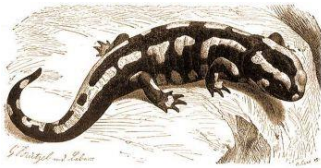
Foltos szalamandra (Salamandra atra)

A római törvénykönyvek méregkeverőnek nyilvánították és kivégezték azt, aki szalamandra húst adott másnak. Arisztotelész úgy tartotta, hogy ha egy szalamandrárt beletesznek a tűzbe, a tűz kialszik. Plinius, római természettudós szerint a szalamandra kizárólag tűzben él, mert bőre olyan hideg, hogy a lángnyelveket is csak langyos simogatásnak érzékeli. E hiedelmek miatt a régmúlt időkben a szalamandráknak ajánlatos volt elkerülni a tűzvészeket, mivel a tűz eloltására gyakran vetették őket a lángok közé. Az alkimisták sem kímélték a szerencsétlen állatokat, mert azt gondolták, ha olvasztótégelybe teszik a kis kétéltűt, és az elszenesedett testére higanyt csöpögtetnek, aranyat kaphatnak. Ma már nem fenyegeti ilyen veszély, hiszen - mint minden hüllő és kétéltű – hazánkban védett.