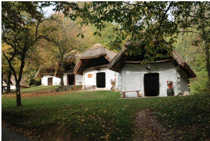
A cádi Szabadtéri Néprajzi Gyűjtemény

Továbbstétálva a hegyen, a hétvégi házak, nyaralók között is bújnak meg régi emlékek. Még öt borona-pincét láthatunk. Ezeket kisebb-nagyobb mértékben átalakították, de még őrzik régi jellegüket. Némelyiknek csak a zsúptetejét cserélték palára. Műemlékileg nem védettek, de tulajdonosaik őrzik elődeik örökségét.