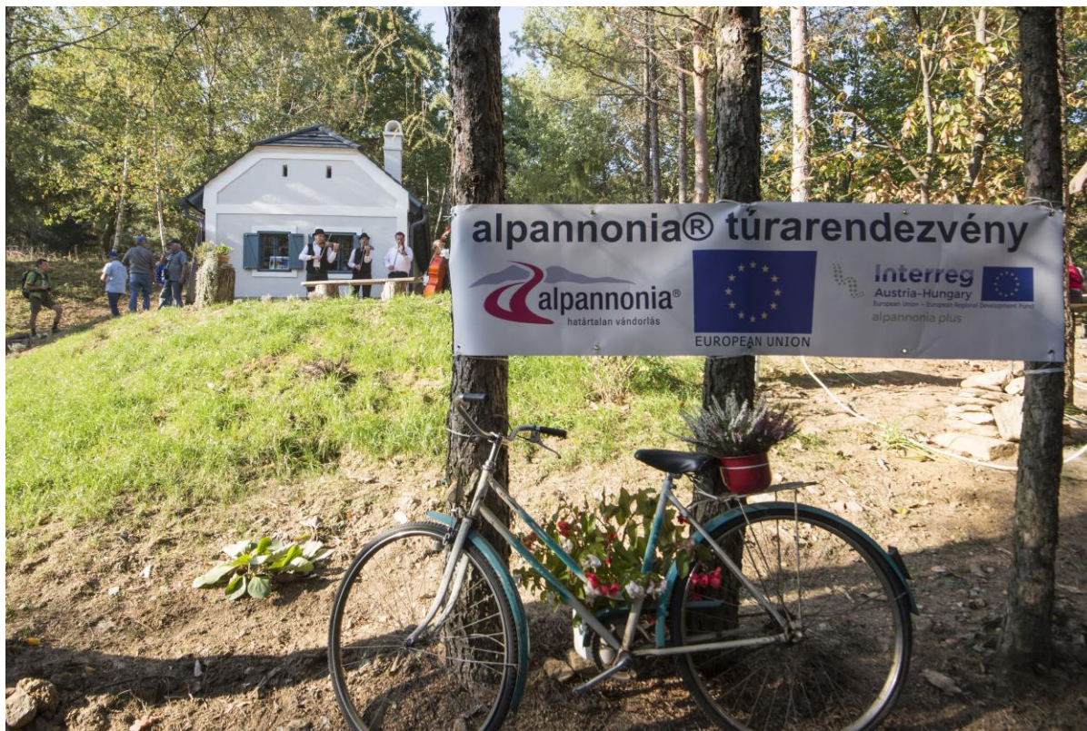
Az Alpannonia® fogadópont átadója 2018-ban

A pincesor pár évvel ezelőtti fényképeit nézegetve szembe tűnik egy erősen felújításra szoruló, de bájos házikó a domboldalon. Ezt a házat egy határon átnyúló pályázat keretén belül 2018-ban a község önkormányzata megvásárolta, szépen felújította, és pihenő-fogadóponttá alakította, mely információs pontként szolgál az Alpannonia® túraútvonal nyújtotta lehetőségekről.