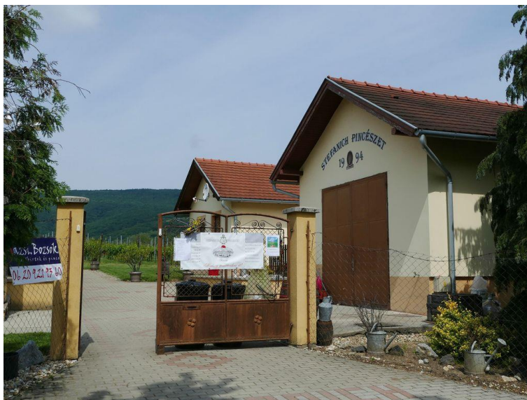
A Stefanich Pincészet a Botosok tetején

Chardonnay, Kékfrankos, Kékfrankos-rosé, Blauburger, Merlot, Jurisics-Vére Cuveé (zászlós bor)