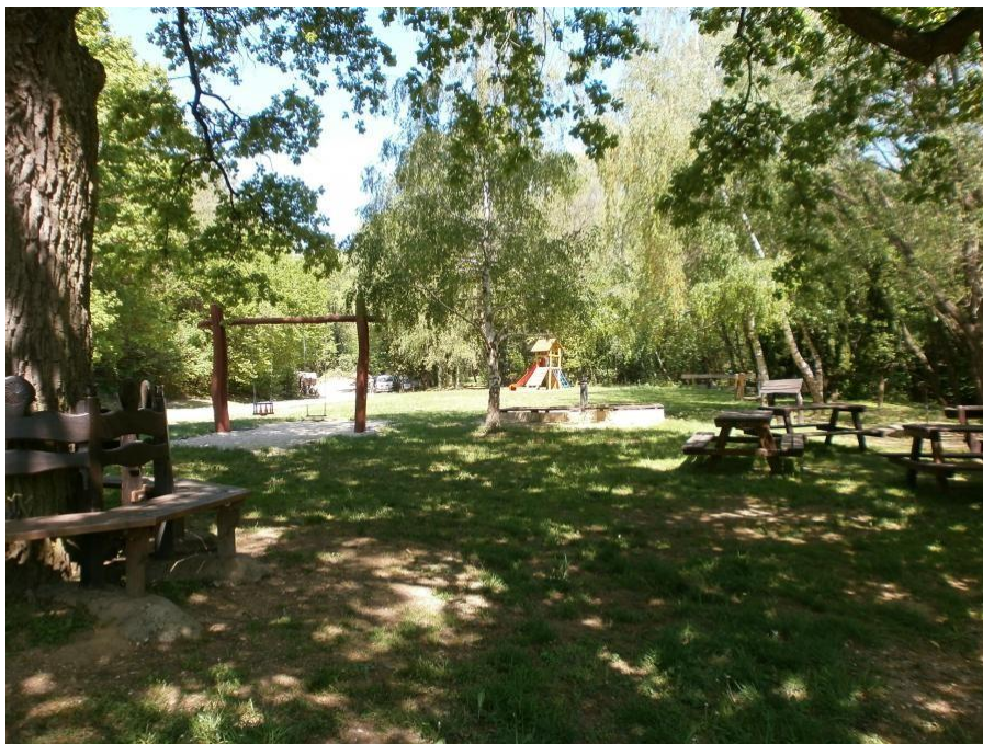
A Căci játszótér

A megyében híre van a cáki játszótérnek, mely 2010-ben pályázati forrásból épült. Különösen nyári időszakban telik meg élettel – sok alsó tagozatos osztálykirándulás úti-célja a Pincesor, és a játszótér. A szünidőben nagyszülők buszoznak ki ide Kőszegről és a környező falvakról az unokákkal kirándulni és játszani. A tiszta völgyi levegő, az öreg tölgy adta árnyék, a Cáki patak csobogása és a mindent betöltő csendes nyugalom az, ami ide vonzza a kisgyerekes családokat is. Az itt található forrás vize régen iható volt, ma már nem alkalmas fogyasztásra. Az eltelt tíz év alatt több vihar is jelentős károkat okozott a játszótéren, így mára megérett a felújításra.