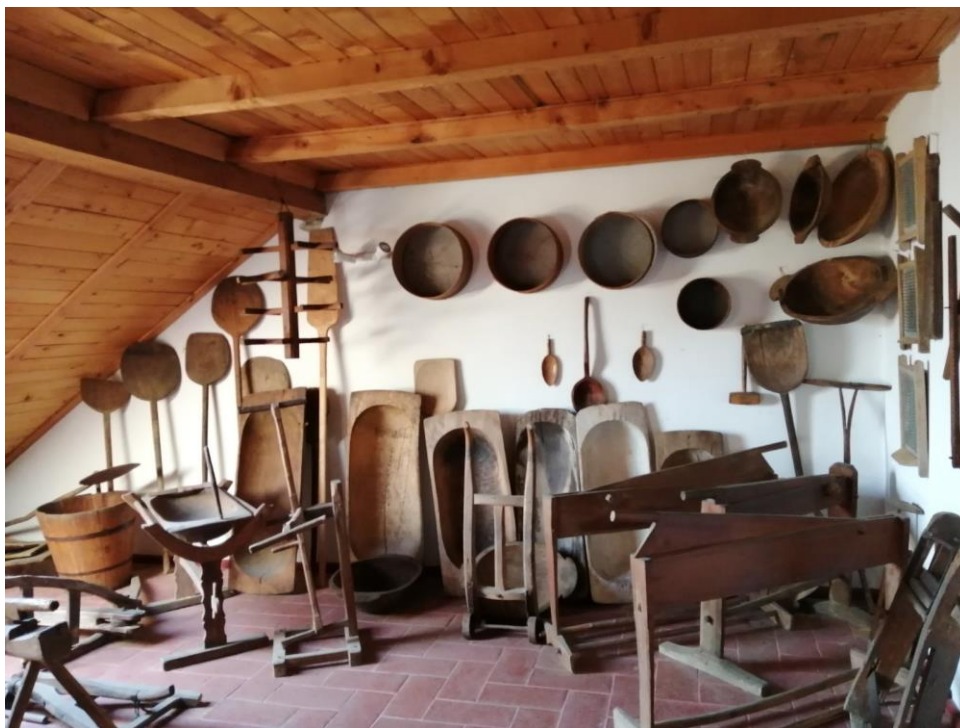
Régi háztartási eszközök a Stefanich gyűjteményben, Fotó: Stefanich Kornél