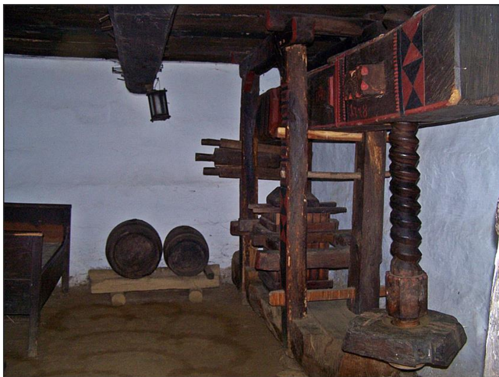
Cáki pincebelső művészen faragott préssel

A pincesor több pincéjében eredeti berendezési tárgyakat állítottak ki, köztük a szőlészeti-, borászat tárgyi emlékeit. A berendezések legértékesebb darabjai a prések, szám szerint hat darab. Vannak köztük kőhúzó-, és bálványos szerkezetűek is, festettek, faragottak. A legrégebbi 1778-ban készült.