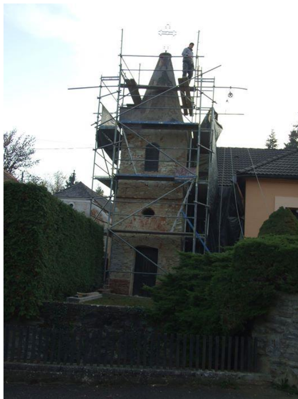
Az evangélikus harangláb felújítása 2016-ban