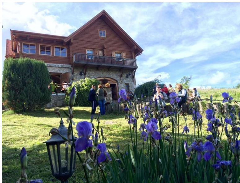
A Mándli Borház