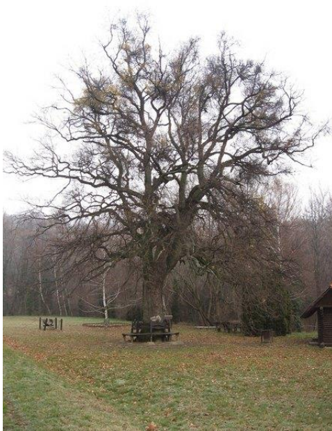
A 150 éves tölgy a Kőfejtő szomszédságában

Két nagy tölgyfa is áll a faluban, egyik a kőfejtő mellett a játszótéren, a másik a Községi Ház udvarán. Mindkettő körülbelül 150 éves. Tekintélyes törzsátmérőjükkel tiszteletet ébresztenek az arra járókban. A kőfejtő mellett álló famatuzsálem körül kialakított padokon bárki letelepedhet és kényelmesen megpihenhet az idilli környezetben.