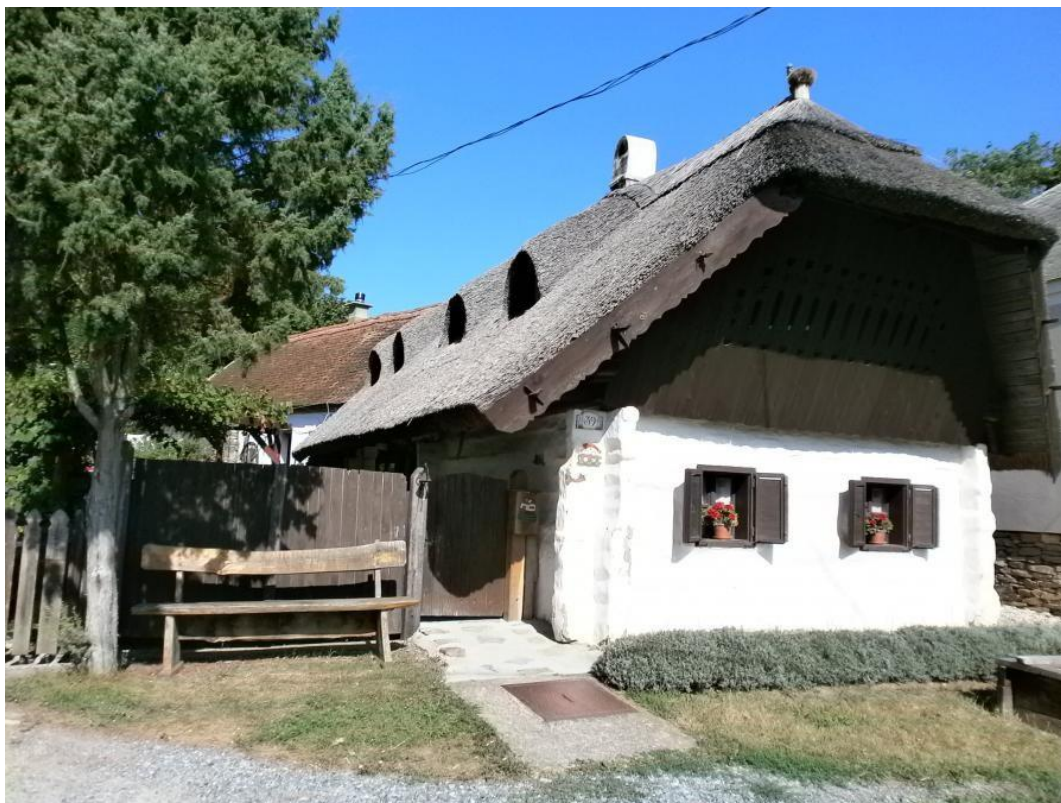
Căki parasztház, Petőfi utca 39.

A Petőfi utcában álló 19. században épült nádtetős bájos parasztházat „népi lakóház” kategóriába sorolással vették műemlék-védelem alá. Az épület nagyon szépen rendben van tartva, eredeti jellegét gyönyörűen megőrizték, jelenleg is lakóházként funkcionál. Napjainkban felújítási munkálatok zajlanak a Műemlékvédelmi hatóság felügyeletével.