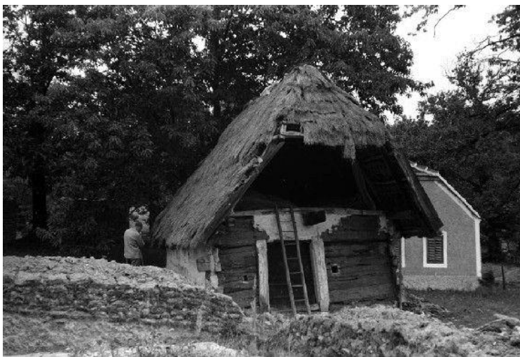
A pincék helyreállítási munkálatai a Vasi Múzeumfalú dolgozóival (1974-1975)