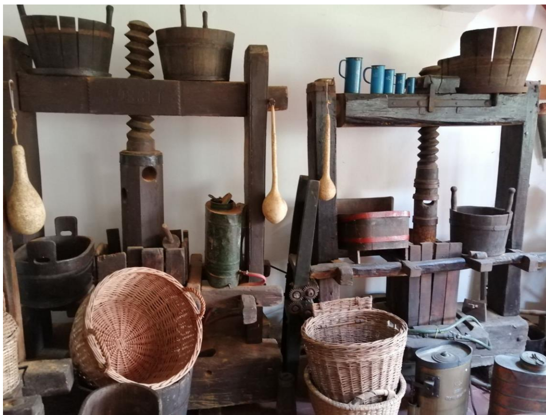
A Stefanich gyűjtemény borászati eszközei