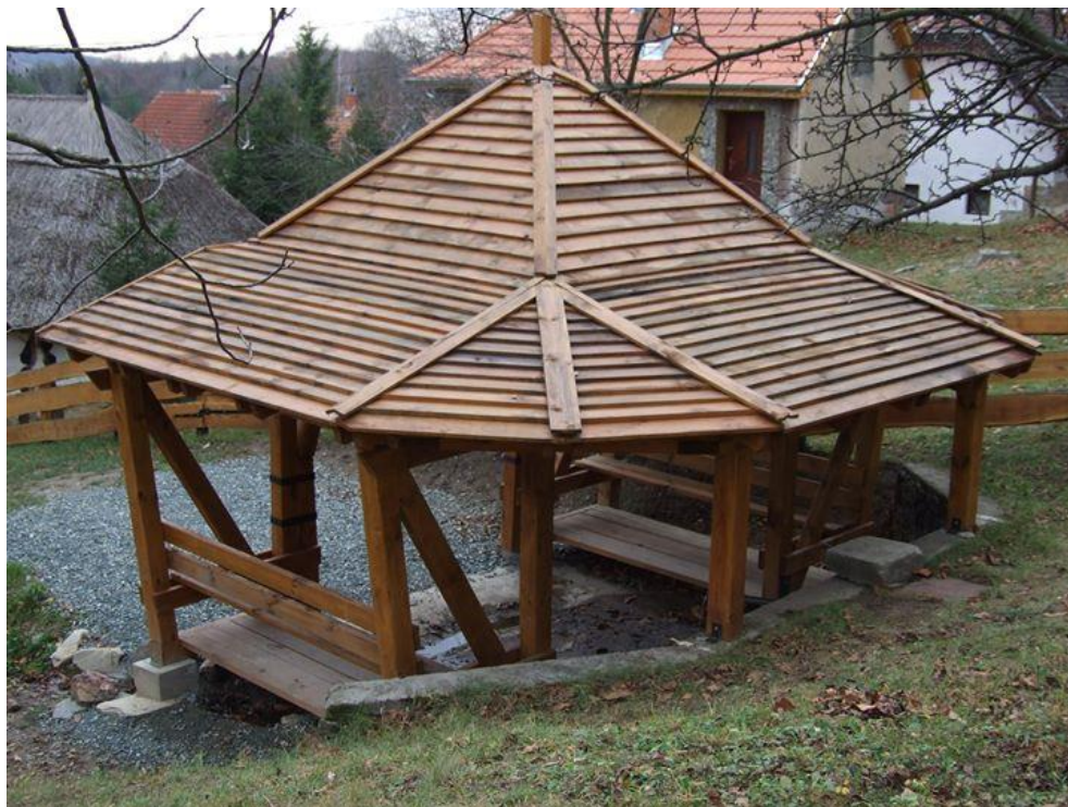
A Csurgó, Fotó: Gál Bea

A pincesor melletti forrást, a Csurgót sokáig a boroshordók mosására használták, innen ered a hordómosó forrás elnevezés. Vize kiváló minőségű, sokan messziről is elautóznak érte, és palackokban viszik haza otthonaikba. Magyarország egyik legtisztább ivóvizét tudhatják magukénak a cákiak, amit a rendszeres bevizsgálás tanúsít.