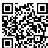
QR kód 1a.1

Útvonal: Pretul, Rosegger Schutzhaus - Hauereck Schutzhaus - Jägerhöhe - Waldschule és Peter Rosegger szülőháza (opcionális) - Lendkreuz - Teufelsteingipfel - Zeller Kreuz - Fischbach